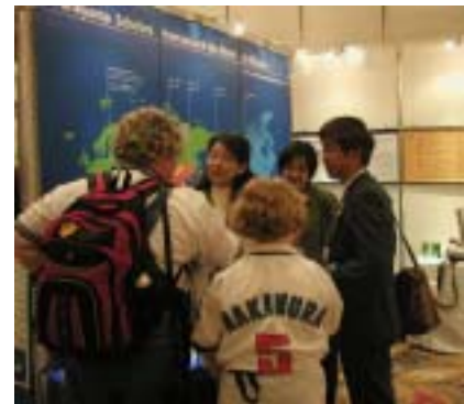
国内外のロータリアンが来訪

米山奨学会では、5月22日(土)~26日(水)の5日間、大阪国際大会の『友愛の家』に出展し、事業紹介の展示を行いました。RI国際大会に米山記念奨学会が参加するのは初めてのことであり、国際大会(関西)実行委員会の皆さまをはじめ、多くの関係ロータリアンのご尽力をもって実現しました。ブース来訪者は300名を超え、日本のみならず、世界各国のロータリアンに、米山奨学事業を知っていただく絶好の機会となりました。